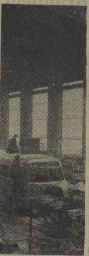
Załoga hali montażowej autobusów Sanockiej Fabryki Wagonów produkująca ka roserie do autobusów „Star 52”, przyczep i samochodów pożarniczych — dla uczczenia święta 1 Maja podjęła zobowiązanie wyprodukowania w kwietniu 1 autobusu ponad plan. Na zdjęciu: fragment hali montażowej.