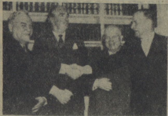
Na zdjęciu: z wizytą u premiera Edena. Przewodniczący Rady Ministrów ZSRR Bułganin (z lewej) wymienia uścisk dłoni z ministrem spraw zagranicznych Wielkiej Brytanii — Lloydem. Pośrodku stoją — premier Wielkiej Brytanii Eden i sekretarz KC KPZR Chruszczow.