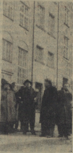
Bawiący w Polsce na zaproszenie ZBoWiD senatorowie francuscy. W dniu 7 bm. Gdańsk.

Na zdjęciu: senatorowie francuscy na Starym Mieście w Gdańsku.