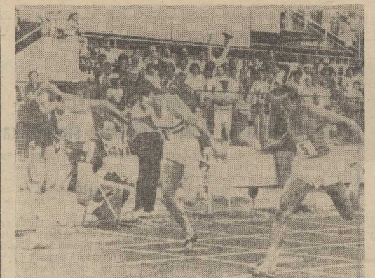
FINAL lekkoatletycznego Pucharu Europy w Turynie. Bieg na 100 m mężczyzn wygrywa Włoch Mennea (5) przed Woroninem (z lewej).

ZDOBYCIE przez Arkonię tytułu mistrza kraju, jest dla tej drużyny w obecnym warunkach, szczytnym osiągnięciem. Wynika to z tego, że zgodnie z decyzją GKPFIS piłka wodna znalazła się wśród tych dyscyplin, które zostały wyłączone z rozgrywek międzywojewódzkich jako nie rokujące sukcesów. Trudno dziś z tą decyzją polemizować. Faktem jest, że od wielu już lat dyscyplina ta nie rozwija się tak jakbyśmy oczekiwali. Wprost przeciwnie, śledząc rozgrywki zauważamy spadek zainteresowania piłką wodną, co przejawia się w coraz mniejszej liczbie drużyn grających w jedynej tylko krajowej klasie rozgrywkowej. I tak zniknęły z pola widzenia takie zespoły jak Polonia Bytom, Śląsk Wrocław czy też Stal Stocznia. Ten decydujący fakt jest trudny do wytłumaczenia bowiem z roku na rok poprawiają się naturalne warunki do uprawiania tej dyscypliny sportu. Mamy przecież coraz więcej basenów. Ponadto piłka wodna ma duże potencjały zaplecze — całą rzeczną pływak, który nie rezygnuje z udziału w igrzyskach, ale-ja-latkowie z powodzeniem mo-