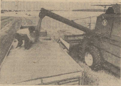
Zbiór jęczmienia w rejonie Choszczona.

WARSZAWA PAP. Szybko po- stępują prace żniwne w gmi- nach i województwach, w któ- rych zboża dojrzały do zbioru. Rolnicy spieszą się bowiem ze sprzętem dostarczającym przesu- szone łanów i snopów zestawio- nych w stygi, licząc się z tym, że każde pogorszenie warunków atmosferycznych przysporzyłoby im dodatkowych kłopotów oraz pracy.