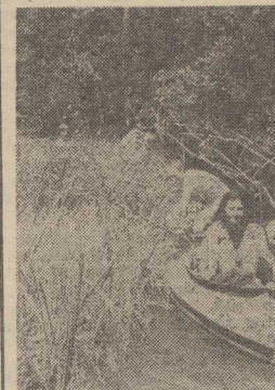
POMIMO pogody „w kratkę” wędniacy nie rezygnują ze spacerów kajakowych. Jak co roku Czarna Hańcza płyną setki amatorów tej atrakcyjnej formy wypoczynku.

Do końca lipca br. przepłoniono 50 ton monet. Każdorazowo dostawa monet trzymiana jest do ostatniej chwili w tajemnicy, a nadzorują ją — aż do zakończenia wytopu — pracownicy banku.