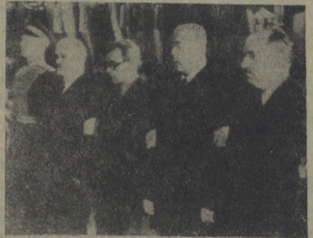
U trumny Bolesława Bieruta wystawionej w sali kolumnowej gmachu Związków Zawodowych w Moskwie. (Od lewej) W. M. Molotow, Fr. Mazur, J. Cyrankiewicz, L. M. Kaganowicz.

plywają tłumy. Na wszystkich twarzach maluje się smutek. Oczy przechodzących zwrócone są na białą, spokojną, jakby pogrążoną w głębokim śnie, twarz Zmarłego. Są ostatnie pożegnania.