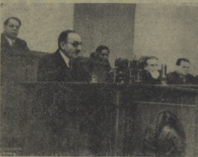
XX ZJAZD KPZR Na zdjęciu górnym: widok trybuny. I sekretarz KC KPZR N. S. Chruszczow wygłasza referat sprawozdawczy.

WARSZAWA. Ministerstwo Oświaty zawiadomiło, że nauka w szkołach podległych ministerstwu zostanie wznowiona w dniu 20 lutego br. W razie nawrotu fali silnych mrozów należy stosować się do poleceń okólnika nr 32 z dnia 16 listopada 1954 roku.