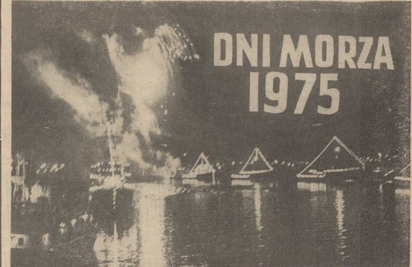
TYLKO raz w roku możemy oglądać szczeciński port tak właśnie iluminowany. Na zakończenie Dni Morza i święta „Głosu Szczecińskiego” odbył się tradycyjny „KARNAWAŁ NA DODRA”. Gdy zapadł zmrok niebo rozjaśniły sztuczne ognie, a po wodzie sunął barwny „Korowód Wenecki”.

HAWANA. Na Kubie przebywa z wizytą oficjalna premier Szwecji Olof Palme. Przewiduje się, że dzisiaj będzie on kontynuować w Vardero rozmowy z premierem Kubę Fidelem Castro. Kuba jest ostatnim etapem podróży szefa rządu szwedzkiego po Ameryce Łacińskiej, w trakcie której odwiedził on również Meksyk i Wenezuelę. We wtorek Palme powraca do kraju.