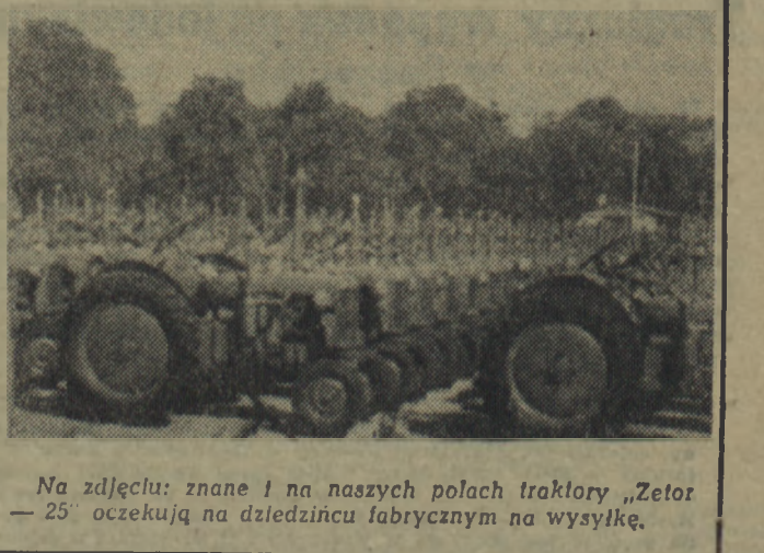
Na zdjęciu: znane i na naszych polach traktory „Zetor - 25” oczekują na dziedzicu fabrycznym na wysyłkę.

Coraz więcej chłopów wstępuje do spółdzielni produkcyjnych. W ciągu miesiąca lipca ub. roku wstąpiło do spółdzielni ok. 3 tys. chłopów słowackich.