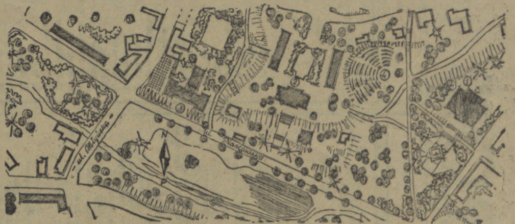
Tak wyglądać będzie w najbliższych latach dzielnica Koszalina w okolicy ul. Piastowskiej i Młyńskiej. W perspektywnym planie rozbudowy miasta powstaną tam szeregi gmachów użyteczności publicznej. Zakreślane miejsca oznaczają zaplanowane budowle. Gmach z cyfrą 1 — to przyszły Pałac Młodzieży, z cyfrą 2 — nowy Dom Kultury i z cyfrą 3 — projektowana siedziba sądu. W miejscu oznaczonym cyfrą 4 — powstanie teatr.

z kolei węzła problem w Koszalinie to kwestia mieszkaniowa. Koszalin zniszczony w 40 proc. podczas działań wojennych, pod względem zaludnienia wzrósł przeszło dwukrotnie w ciągu ostatnich 10 lat. Tak np. w roku 1946 liczył 16 tys. mieszkańców, natomiast w końcu 1955 roku 35 tysięcy. Jasne, że przy tak szybkim wzroście ludności, zwłaszcza od czasu powstania województwa, nie mogliśmy nadążyć z budową mieszkań i dla tego dzisiaj jeszcze sytuacja mieszkaniowa nie jest najlep-