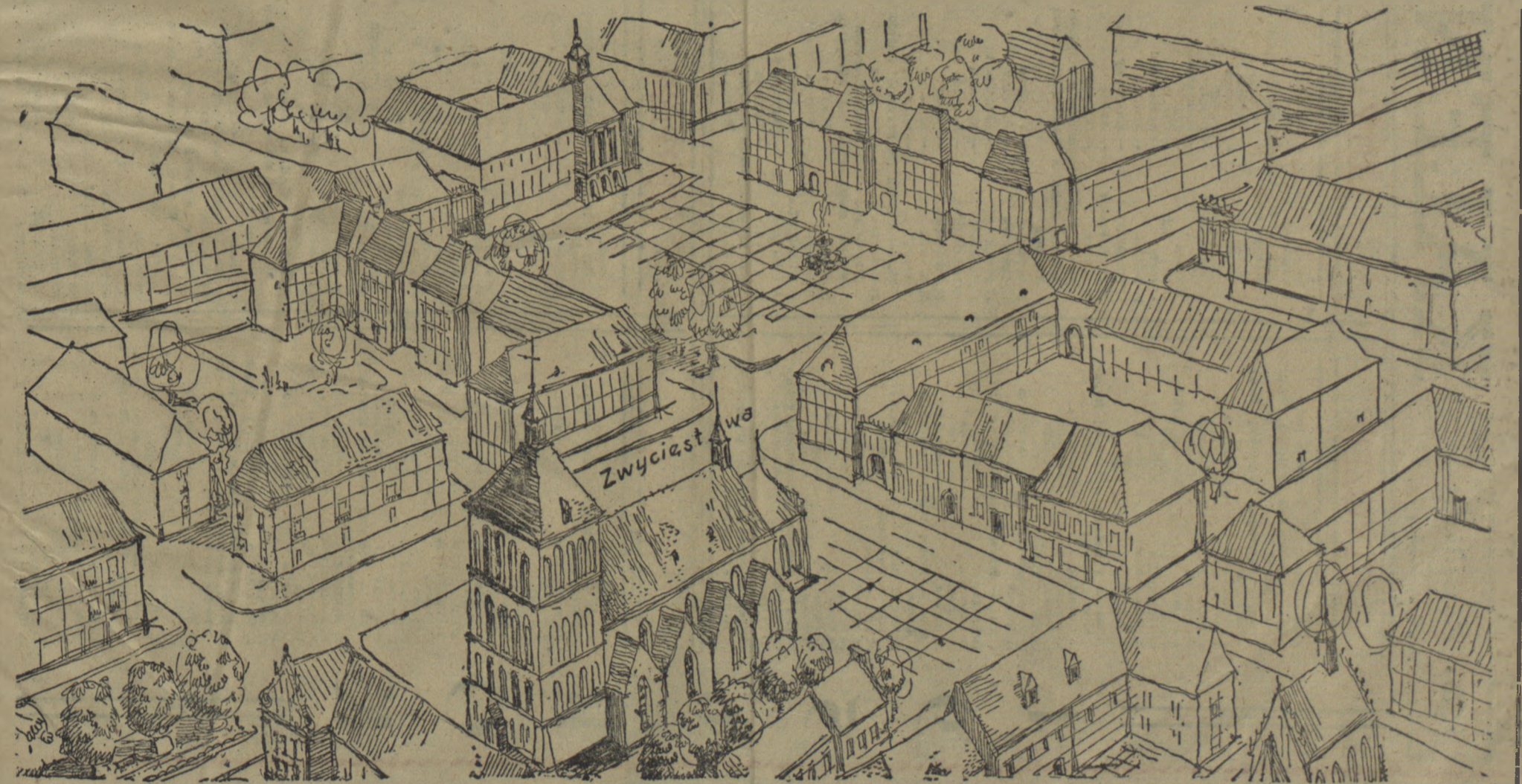
Szkic koncepcyjny śródmieścia Koszalina, wykonany przez Pracownię Urbanistyczną Wojewódzkiego Zarządu Architektoniczno-Budowlanego.

ki”. Warto więc tu nadmienić, że do roku 1960 zostanie całkowicie zakończona jej budowa. Koszalińska „Starówka” będzie dzielnicą zupełnie nowo-