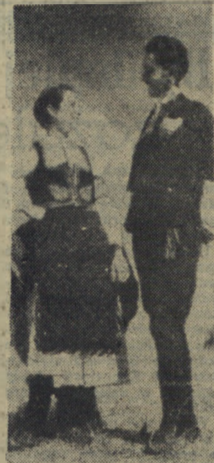
SERBSKIE STROJE LUDOWE