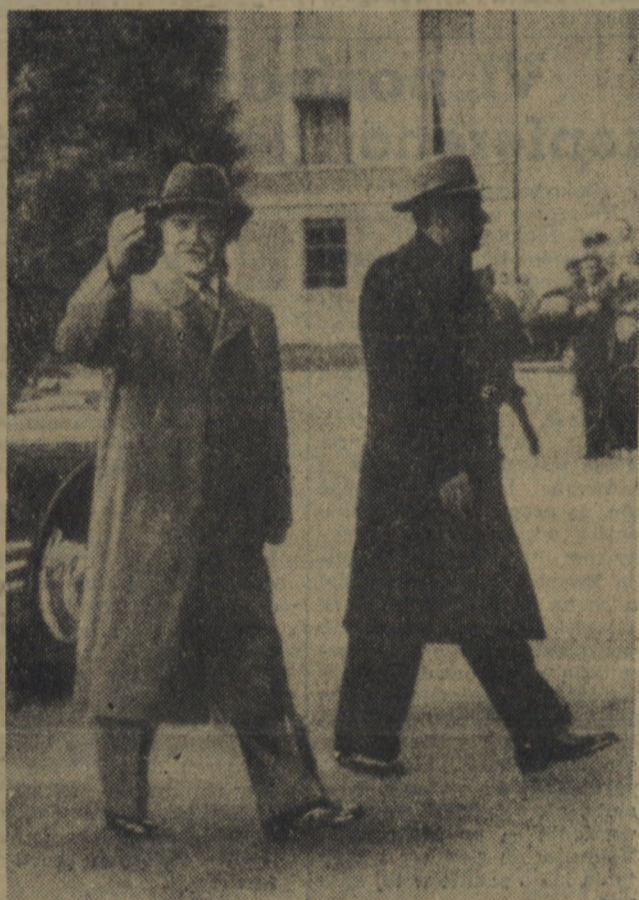
Na zdjęciu: minister Molotow przybywa na posiedzenie.