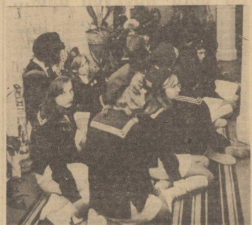
DRUHNY ze Szstandardowego Szczepu HSPS przy Zespole Szkół Ekonomicznych nr 2 nawet na siedząc efektywnie prezentują się w wodniackich s trojach.

Na zakończenie swego listu do redakcji zuchy i instruktorzy z SP nr 2 dziękują serdecznie tym aktorom „Pieciugni”, którzy poświęcając własny czas, przyczynili się do radości zuchów.