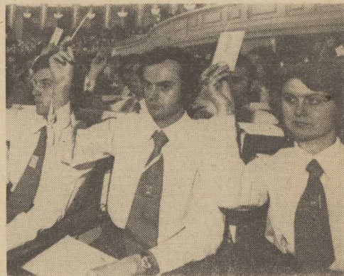
NA ZDJĘCIU: głosowanie nad projektem uchwały powołującej Związek Socjalistycznej Młodzieży Polskiej.

29.4. WARSZAWA PAP. W Warszawie kończą się dziś po południu obrady I Krajowego Zjazdu Związku Socjalistycznej Młodzieży Polskiej. Organizacja ta powstała w środę — na mocy decyzji krajowych zjazdów ZMS, ZSMW i narady aktywności SZMW sił zbrojnych PRL, które postanowiły powołać jedną wspólną organizację młodzieży pracującej miast i wsi. Dyskusja, jaka toczyła się w polskim ruchu młodzieżowym wykazała, że w powstaniu ZSMP młoda generacja Polaków upatruje jeden z sposobów jeszcze aktywniejszego udziału w realizacji programu budowy nowego społeczeństwa socjalistycznego.