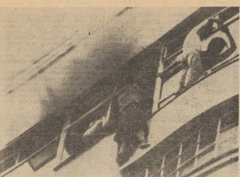
27 BM. w brazylijskim mieście Porto Alegre wybuchł pożar w 10-piętrowym budynku, gdzie znajdował się sklep z odzieżą. 26 osób zginęło a ponad sto zostało rannych.