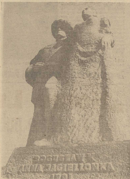
ANNA JAGIELLONKA I KSIĄŻĘ BOGUSŁAW X wtopili się już bez reszty w zamkowy pejzaż, stanowiąc — mimo młodego wieku tego udanego i lubianego przez szczecinian pomnika — szacowny zabytek.