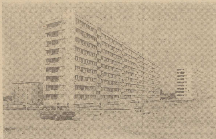
„PRZYPIŃNĘŁY DOMY Z LENINGRADU”. Przypińnięty i oto stoją na osiedlach Przyjaźń i Kalina. A następne, i dalsze, już na kolejnych placach budowy... To konkretne, wymierne efekty naszej współpracy z radzieckimi przyjaciółmi: stocznicy, którzy niejedną zwodowali już statek dla radzieckich armatorów, są właśnie w dużej mierze lokatorami leningradzkich domów.