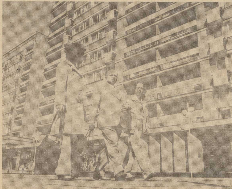
SPACER W WIOSENNYM SŁONCU, nowymi szczecińskimi ulicami przy których stoją nowe szczecińskie domy...

MIASTU PRZYBYWA LAT, a przecież możemy bez żadnej przesady powiedzieć, że młodnieje nam Szczecin. Od 31 lat, co roku w kwietniu robimy coś w rodzaju bilansu: podsumowujemy nasze osiągnięcia, nasze szczecińskie aktywa... I chociaż wiele jest jeszcze do zrobienia, to przecież dokonania całego szczecińskiego 31-lecia, szczególnie zaś ostatnich lat i miesięcy, napawają uzasadnioną dumą. Zapraszamy na krótki spacer po Szczecinie roku 1976.