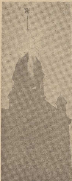
ZAMEK I NIE TYLKO... Wszyscy wspólnie odbudowywaliśmy ze zniszczeń wojennych historyczną siedzibę książąt pomorskich. I oto dziś dzieło odbudowy zbliża się do końca, zaś zamkowy kompleks w którym znaleźć można i coś dla ducha (WDK z przyległościami), i coś dla ciała (kawiarnia „Zamkowa”) stanowi najchętniej odwiedzane przez szczecinian i przyjezdnych miejsce.