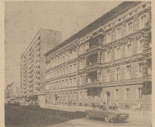
NOWA i odnowiona al. Wojska Polskiego.

Ojcowie miasta noszą się z zamiarem zorganizowania publicznej dyskusji, w której każdy będzie mógł wypowiedzieć się na ten temat. Rozsądne opinie w połączeniu z propozycjami specjalistów będą podstawą do podjęcia decyzji. (jas)