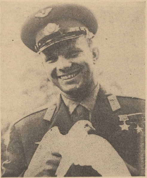
Jurij Gagarin — pierwszy kosmonauta.