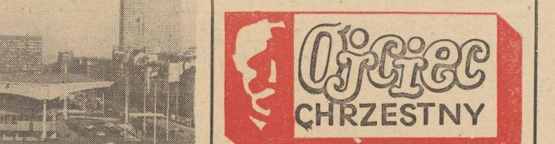
Tytuł oryginału „The Godfather” Tłumaczył: Bronisław Zieliński

W tym celu wyrażaliśmy namierzone krzywdy kierowcom PPKM „Gryt” oraz PZM, obsługującym wspomniane autobusy w ramach działalności Wojewódzkiego Przedsiębiorstwa Komunikacji Miejskiej.