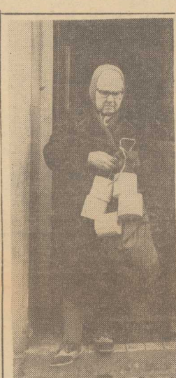
NARESZCIE JEST!

AŻ wierzyć się nie chce, że przez tak długi okres czasu nikt autorytatywnie nie stwierdził, dlaczego wysychają szczecińskie jeziora, czemu mniej wody mają podmiejskie tereny rolnicze? Dopiero teraz czynione starania dają szansę poprawie sytuacji i nadzieje, że przynajmniej Głębokie zostanie uratowane. Duże znaczenie będzie tu mieć uruchomienie magistrali miedwińskiego jeziora w znacznym stopniu odciążą miejskie stacje pomp. Interesując się tym zagadnieniem od tyłu lat jestem bowiem zdania, że jednak nadmierna eksploatacja ujęcia wody spowodowała krytyczną sytuację. (jas)