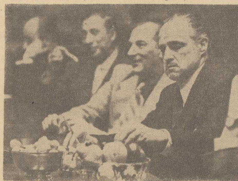
Marlon Brando jako Don Corleone w głośnym filmie

24.3. KAIR PAP. Nie ustają krwawe walki w Bejrucie. Po raz pierwszy od wznowienia starć między prawicą a lewicą został ostrzelany teren pałacu prezydenckiego. Siły lewicowe zbliżają się coraz bardziej do Beit Meri - punktu oporu prawicy, z którego ta ostrzeliwała muzeumskie dzielnice Bejrutu. Zdobyć Beit Meri oznaczałoby otoczenie przez jednostki lewicy pałacu prezydenckiego.