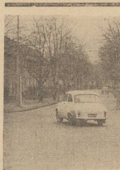
SKRZYŻOWANIE ul. ul. Witkiewicza, Santockiej i Poniatowskiego. Strzałką zaznaczony znak, który nie kierowcom nie wyjaśnia, bowiem ktoś obrócił go w drugą stronę.

Sprawy postanowiliśmy wyjaśnić u źródła. Według informacji udzielonych nam w dyrekcji zakładu nieodór gazu w sieci na Niebuszewie wiąże się z poważną awarią zbiornika w tejże dzielnicy. W piątek zapewniano nas, że gazownia dołoży wszelkich starań, aby do rana złagodzić skutki uszkodzenia, przesyłając więcej gazu w ten rejon miasta. Do generalnego remontu zbiornika na Niebuszewie przystąpiła monterzy zakładu gazownictwa dopiero w styczniu. (Macz)