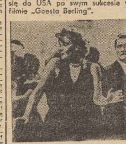
NA ZDJĘCIU: Greta Garbo w jednym ze swych filmów.