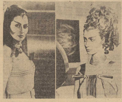
CATHERINE SCHELL, grająca rolę egzotycznej mieszkanki dalekiej planety w nowym brytyjskim serialu telewizyjnym pt. „Kosmos 1999” prezentuje „Kosmiczną” maślacz i frużare.

Agencje informują również, z powołaniem się na „wiarygodne źródła w Pekinie”, że oprócz czterech członków kierownictwa chińskiego, reprezentujących wydziały rządowe, zostało podobno aresztowanych około 30-40 dalszych działaczy tego ugrupowania, wśród nich minister kultury. W tym samym czasie o raz korespondent prasy zachodniej w Pekinie donosił, że 12 mb. na teren uniwersytetu pekińskiego wkroczyły oddziały wojskowe i jak się przypuszcza — dokonaly aresztowań wśród studentów i kadry pracowników, naukowych, będących zwolennikami radykalizmu. Rzeczni rządowy w Pekinie odmówił wszelkich komentarzy na tematy dotyczące wspomnianych aresztowań.