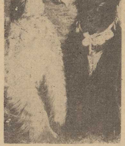
TE dumne i wspaniałe psy — to charty afgańskie. Na wielu wystawach w kraju i za granicą zdobyły ponad 30 złotych medali.

SŁOWA te padły w Mielcu, choć odnoszą się do każdego z miast, do każdej z fabryk, nie chcemy zwiększania produkcji za wszelką cenę — stwierdził tam Edward Gierak — określając w ten sposób najistotniejsze wymagania, jakie społeczeństwo stawia przed gospodarką, a więc przed wszystkimi pracującymi. Dla życia wszystkich i każdej rodziny z osobna liczy się dziś bardziej niż kiedykolwiek, przede wszystkim efektywność naszej ekonomiki.