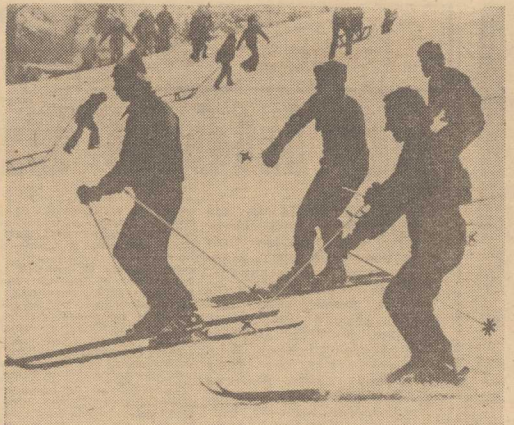
SNIEGU mało, wystar- czy jednak by szusować z pagórków w Parku Kas- prowicza.

Tyle o młodzieży. A teraz słów kilka o konsekwencjach 16 ustawionej pracy z młodzie- żą: brak rezerw i ostatnie miej- sce w tabeli, groźba spadku do ekstraklasy — oto efekty. Nie bijemy jednak na alarm, dawno już to uczyniono. Rzecz cieka- wa — głos dzwonoł alarmow- ych, choć bardzo głośny, nie dociera do Pogoni. A szkoda... (Tar)