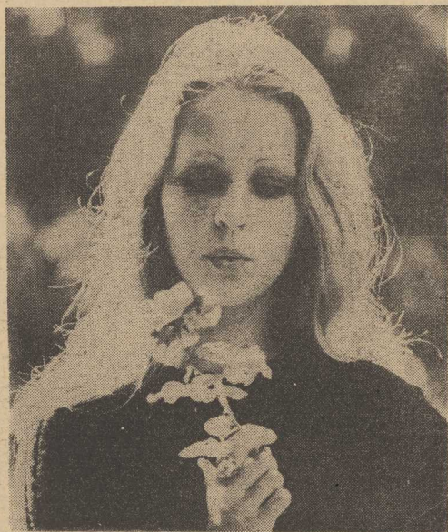
W jesiennym słońcu.

JAK pisze „Sztandar Młodych”, Zjednoczone Przedsiębiorstwa Rozrywkowe już w czerwcu czyniły starania, żeby zorganizować kilka występów szwedzkiego zespołu. Ostatecznie „PAGART” ma sprawa dzić te grupę na zaproszenie TV Polskiej i to już niedługo, bo 7 października. ABBA wystąpi w programie „Studia 2” (emisja 6.XI), gdzie przypomni 11 swoich największych przebojów — od „Waterloo” do „Dancing Queen”. Na tournée po Polsce szwedzki zespół miałby przyjechać dopiero w przyszłym roku.