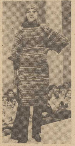
OGROMNE pole do popisu mają panie zajmujące się dzierganiem na własny użytek. Działania bowiem, i to zarówno ręczna jak i maszynowa, jest coraz popularniejsza. Szczególnie modne są ostatnio tuniki — jak na naszym zdjęciu.

WSRÓD wielu imprez, o których informować będziemy na bieżąco, czeka mieszkańców naszego miasta tradycyjny i zawsze atrakcyjny kiermasz wyrobów artystycznych CSRS. Dodajmy, że w tym roku kupować na nim będzie można również obrazy czechosłowackich artystów. (Up.)