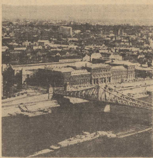
BUDAPESZT. Most Wolności — pierwszy odbudowany zniszczonej wojny w 1946 r. W głębi widoczny gmach Wydziału Ekonomii Uniwersytetu im. Karola Marksa.