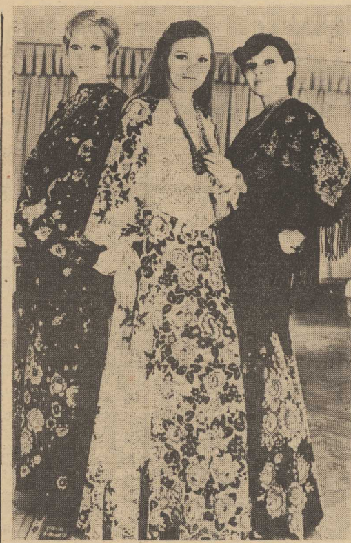
TEGOROCZNA radziecka moda jesienią wyraźnie inspirowana folklorem.

Przeżywanie — to jest wytrzymałość organizmu człowieka. Wzrost wydajności pracy. Zwiększenie tzw. luki inflacyjnej, tj. przewagi efektywnego popytu ludności na dobra konsumpcyjne nad ich podażą, możliwe jest do osiągnięcia — w zależności od rozmiarów tej luki — różnymi sposobami. I tak, może to być działanie długofalowe polegające na zmianie proporcji podziału dochodu narodowego na akumulację i spożycie oraz na zmianie struktury inwestycji mającej na celu przyspieszenie wzrostu produkcji dóbr konsumpcyjnych. Środkami krótkookresowego równowagi rynku może być