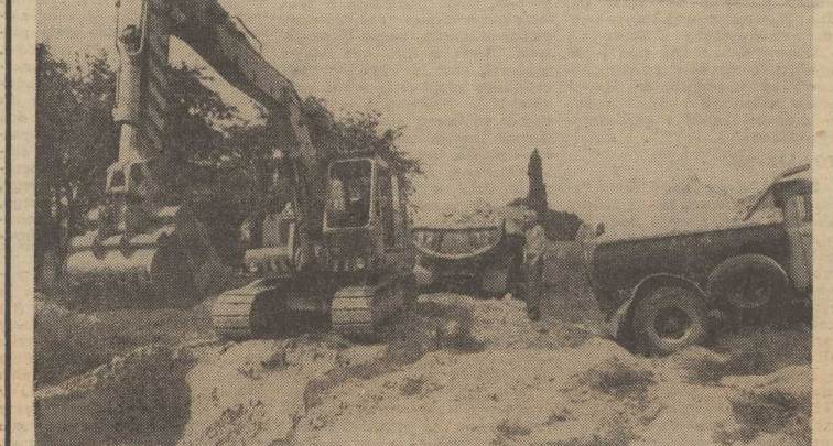
NA ZDJĘCIU: prace ziemne na terenie przyszłego osiedla.

NA PRZYSZŁYM osiedlu mieszkaniowym „Książąt Pomorskich”, gdzie w niedalokiej perspektywie zamieszka ponad 10 tysięcy osób, od kwietnia br. kontynuują się prace ziemne. Obok generalnego wykonawcy – Kombinatu Budownictwa Ogólnego nr 1 – największe obecnie prace spoczywa na Szczecińskim Przedsiębiorstwie Robot Inżynierskich. Są jednak nieznaczne opóźnienia spowodowane nierytmiczną dostawą transportu przez „Transbud”.