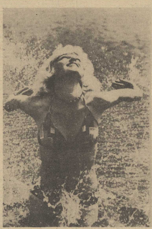
Na letnie upały najlepsza jest kąpiel w morzu.

PARYZ PAP. Podczas ostatniego weekendu w jednym z banków w Niemczech zrabowano ponad 10 mln dolarów w gotówce i papierach wartościowych. Gansterzy dostali się do wnętrza gmachu przez podpokój, który przycięto przy pomocy piły w nocy. Nie wyklucza się, że wysokość łupu bandytów okazała się dużo wyższa, ale będzie można to ustalić dopiero po przesłuchaniu przez klientów strat papierów wartościowych, które zostały złożone w sejfach bankowych. Fakt rabunku stwierdzono przypadkowo w poniedziałek.