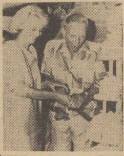
12 BM. odbył się kolejny ślub amerykańskiego pieśniarza Franka Sinatry. Wybórką jest Barbara Marz.