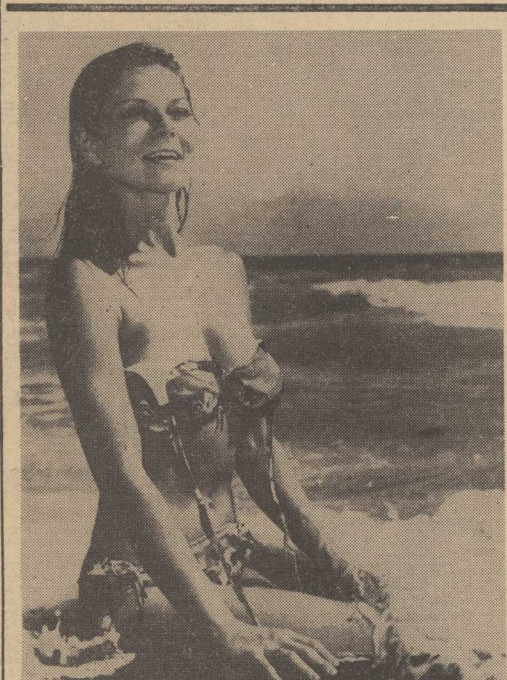
Latem najprzyjemniej nad wodą!

I sekretarz KC PZPR — Edward Gierek spotkał się z przewodniczącym Niemieckiej Partii Komunistycznej — Herbertem Miesem. Podczas serdecznej rozmowy omawiano tematy dalszego rozszerzenia owocnego współdziałania między PZPR a DKP. Wiele uwagi poświecono też ocenie sytuacji międzynarodowej i działalności obu partii dla umocnienia i jedności międzynarodowego ruchu komunistycznego.