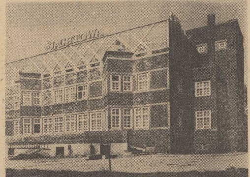
HOTEL i restauracja „Jachtowa” w Szczecinie jest bardzo ładnym obiektem gwarantującym turystom dobre warunki noclegowe. Jednak ostatnimi czasy jest on jakos omijany przez odwiedzających Szczecin liczenie o tej porze roku turystów. Czyżby była to wina odległości od centrum miasta?

Sródmieście - rejon przystocznio- wany, Stocznia „Warskiego” będzie rano rozpoczęła pracę w szcze- ciu porach: o godz. 6, 6.30, 6.45, 7, 7.15 i 7.30. Stocznioy „Gry- fi” przychodzą do pracy o godz. 6.30, 6.45 i 7. „Fambud”, Morska „Szczecin”, Papiernia i Morska Stocznia Jachtowa zaczynają pra- cę o godz. 6, „Lukbud” o godz. 5, 6.45, 7 i 7.15, zaś Zakłady Na- wózów Fosforowych - o 6.30 i 7. Wprowadzone zmiany są raczej niewielkie, lecz bardzo istotne. Wy- dłuża się szczyt przewozowy, dzie- ki czemu jadąc do pracy w róż- nych godzinach, mamy o wiele wy- godniejsze warunki podróży. Auto- busy i tramwaje powinny być mniej zatłoczone, a o to przecież głównie chodzi. (jas)