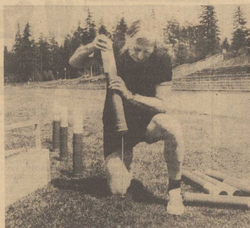
NASI piłkarze przebywający na przedolimpijskim zgrupowaniu w Zakopanem, podczas treningów korzystają z nowego urządzenia technicznego tzw. top-dryblingu. Urządzenie skonstruował płastyk J. Hollender, a składa się ono z 30 słupków metrowej wysokości, które rozkłada się na płycie bieżącej w różnych układach, zależnie od rodzaju treningu. Całość przypomina narciarski slalom-gigant.

Nie sugerujemy, że sędzia jest głównym winowajcą, wydaje nam się jednak, że coś tu nie gra. Jak dotychczas bowiem ukarano, niewinnych. T. R.