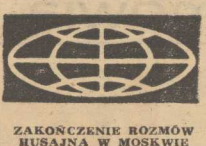
ZAKONOCZENIE ROZMÓW HUSAJNA W MOSKWI

W Moskwie zakończyli się w drodze rozmowy między delegacją jordaniską, na czele której stał król Husajn, a przywódcami radzieckimi. Sirony omówiły sprawy dalszego rozwoju stosunków dwustronnych oraz interesujące je zagadnienia międzynarodowe. Rozmowy przebiegały w przyjacielskiej i rzeczowej atmosferze.