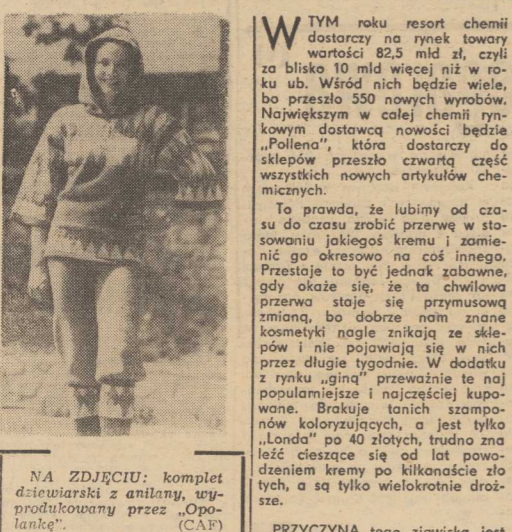
NA ZDJĘCIU: komplet dziurawki z anitany, wyprodukowany przez „Opolankę”.