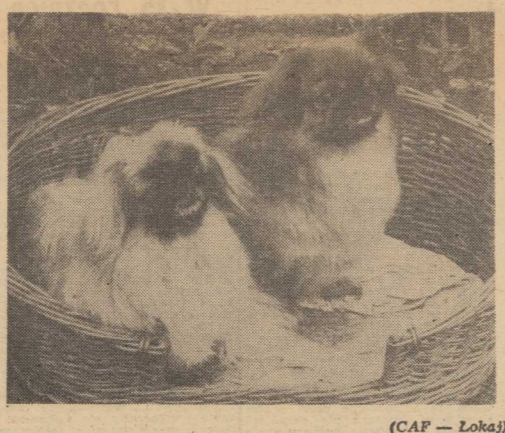
(CAP — Łokaj)