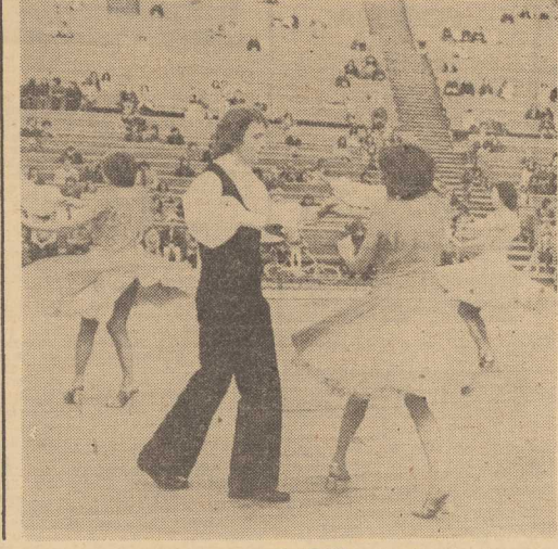
TAK tańczyli młodzi ze stożniowego klubu tanecznego.