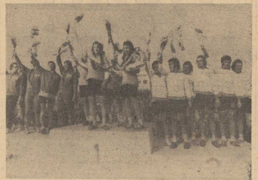
NA ZDJĘCIU: triumfatorzy XXIX WP. W środku drużyna ZSRR (I miejsce), z lewej drużyna NRD (II miejsce) i z prawej polska szóstka (III miejsce).