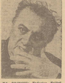
NA ZDJĘCIU: Federico Fellini.

Choć nekany wąpłwościami, reżyser starannie zabrał się do nakreślenia filmu. Koszty produkcji wynoszą już 10 mln dolarów. Fellini zatrudnił dodatkowo 500 osób w trybie pilnym zamówił 54 komplety dekoracji oraz 3 tys. kostiumów i peruk. Jest pedantem jeśli chodzi o detale. Filmową scenę nad kanałem w Wenecji zażył sobie ujęcia, w którym 200 szęziorów kładzie do wody. — Sto! — krzyknął, gdy zauważył, że polowa szęziorów jest biała. — Pomalujcie je na brązowo!