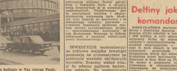
Węgry. Nowo otwarty dom kultury w Vac (okręg Pest).

Pod terminem farby okrętowej kryją się farby różnego przeznaczenia: do malowania pokładów, burty, podkłady różnego rodzaju, emalie kabino-