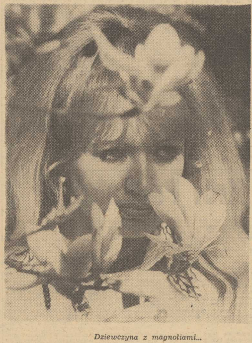
Dziewczyna z magnoliami...

DO PONIEDZIAŁKA spod zawalonych domów wydobyto 813 zwłok ofiar czwartkowego trzęsienia. Praca ekip ratowniczych daleka jest od zakończenia i tutejsze władze nie wykluczają, że pod gruzami można spoczywać jeszcze około 500 zabitych. Od niedzieli w Bzycznych miasteczkach na terenie Friuli odbywają się masowe pogrzeby.