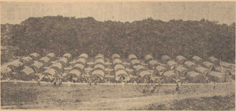
ZE SZCZYTU amfiteatru tak prezentowały się namioty, w których spali harcerze — uczestnicy Złoty Młodzieży „Cedynia 1000”, zgrupowani w miasteczku złotowym w Lysogórkach.

Patriotyczna manifestacja mieszkańców Ziemi Szczecińskiej w 1000-lecie zwycięskiej bitwy wojów Mieszka I i jego brata Czcibora nad oddziałami margrabiego Hlodona pod Cedynią, na Ziemi Chojęńskiej, poprzedził Złoty Młodzieży „CEDYNIA 1000”. Jedno z pięciu zgrupowań młodzieży stanowią harcerze przebywający w miasteczku złotowym we wsi Lysogórki.