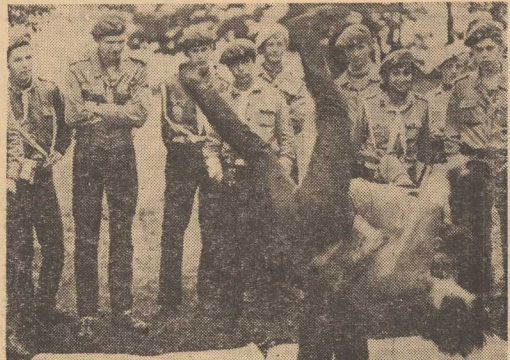
WIECZOREM cały obóz wyruszył do Siedleka na uroczysty apel. W wieczorem, po powrocie z manifestacji, zaczęły odjeżdżać pierwsze grupy uczestników złoty. Kończył się kolejny, piękny, harcerski obóz. Krótki, ale atrakcyjny i historyczny.