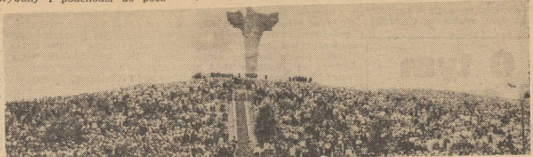
WIDOK na Górę Czcibora, z usytuowanym na jej szczycie pomnikiem „Polskiego zwycięstwa nad Odrą”, w czasie niedzielnej manifestacji.