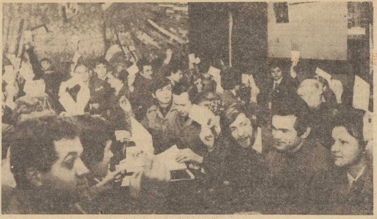
OGOLNY widok sali obrad pierwszej w naszej Chorągwi konferencji okręgowej.