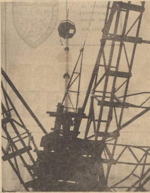
Na zdjęciu maszt już podniesiony