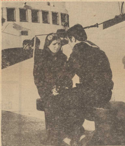
„NIE PLACZ KIEDY ODJĄDE...”

♦ OTWARCIE wystawy pokonkursowej nagrod „Kłoda Morskiego” nastąpi w czwartek, o godz. 13, w Zanku.