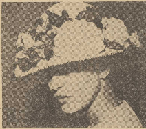
KAPEŁUSZ z naturalnej słonki przystrojony różami — model Paulette. (CAF—AFP)

LONDYN PAP. W pobliżu portu La Coruna (Hiszpania) zatonął hiszpański tankowiec „Idefonso Fierro” przewożący 30 500 ton ropy naftowej. Nie wiadomo się próbą przepompowania ropy do innego tankowca. Przyczyną zatonięcia było uszkodzenie dna statku.