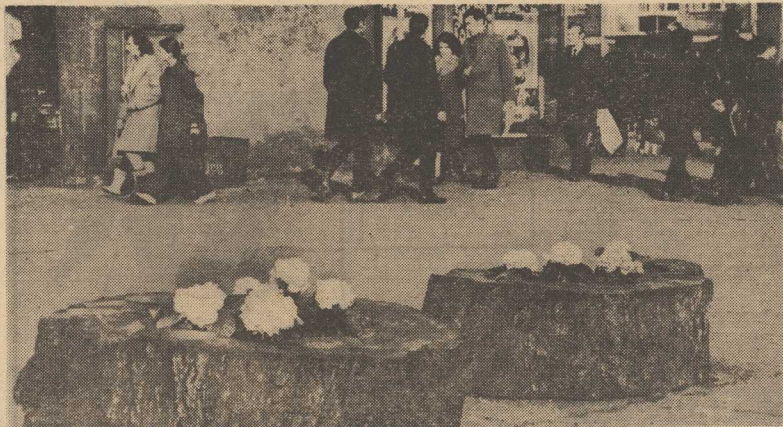
Jeszcze trawniki i drzewa nie zazieleniły się, ale na ulicach już widać kwiaty. Drewniane kłose, które straciły urok, gdy jesienią zmieniła z nich zielen, znów są wielkimi domkami, bożkiem prakownicy Zieleni Zieleni Miejskiej posiadali w nich kwiaty.