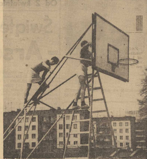
JUŻ WKRÓTCE opustoszeją szkolne sale gimnastyczne, a lekcje wychowania fizycznego odbywać się będą na boiskach. Wiosenne porządki nie mogą ominąć przyszłolnych obiektów. Trzeba więc poświęcić kilka godzin na pracę z grabiami i pędzlem.

Dynamo Moskwa zremisowało z Crvena Zvezda (Belgrad) 1:1. Do półfinału awansował zespół Dynamo Moskwa. Dynamo Berlin - Atvidaberg Sztokholm 2:2. Do półfinału awansowało Dynamo Berlin. Bayern Monachium zremisował 0:0 ze Slesau Birkarew. Do półfinału awansował Bayern. Glasgow Rangers pokonał włoski zespół koszykarzy TRT Daugawa Ryga. Do półfinału awansował Glasgow Rangers.