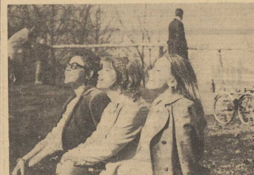
Opalamy się od pierwszego dnia wiosny

NOWY JORK PAP. Dwaj osobnicy, prawdopodobnie Amerykanie, uprowadzili jamański samolot na Kubę. Jak donosi korespondent Reuters z Kingston (Jamaika) osobnicy ci wzięli samolot do lotu turystycznego nad Jamajką. W trakcie lotu sterowaliśmy pilota. Według ostatnich doniesień, samolot wylądował w miejscowości Manzanillo, w południowej części Kuby.