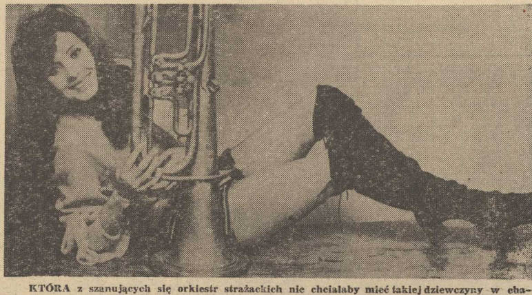
KTÓRA z szanujących się orkiestr strażackich nie chciałaby mieć takiej dziewczyny w ebra- rakterze maskotki.

LIST Prezydium Rządu i Prezydium CRZZ w sprawie doroznych przedsięwzięć zmiatających do poprawy stanu bhp w zakładzie wyrażnie określa zadania poszczególnych instancji, mówi nie tylko o konieczności stosowania sankcji karnych, ale podkreśla również konieczność oddziaływania społeczno-wychowawczego, naczadzenia, wyróżniania i popularyzowania zasłużonych w tej dziedzinie pracowników. (tur)