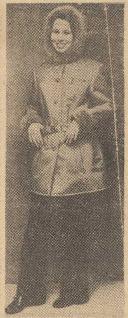
„DANA” myśli przede wszystkim o sukienkach. Ale jeśli handel tego sobie życzy — zwiększy również dostawy ładnych kurtek zortalionu.