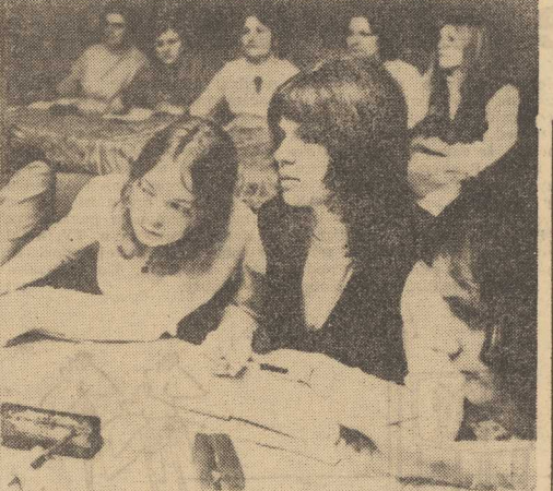
A OTO jeszcze jeden przykład jak w NRD przygotowują się na przyjęcie zwiedzającego, w okresie wiosenno-letnim ruchu turystycznego z Polski. Oto kurs dla 35 ekspedientek z miejscowości Guben, na którym uczą się one języka polskiego.