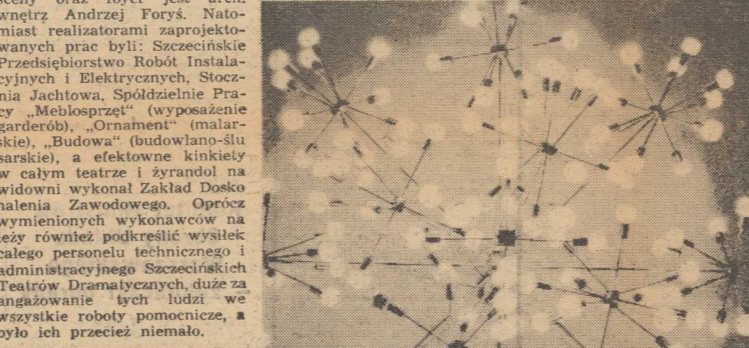
OTO PIĘKNY żyrandol, który swym światłem oświetla salę widowiskową Teatru Współczesnego.