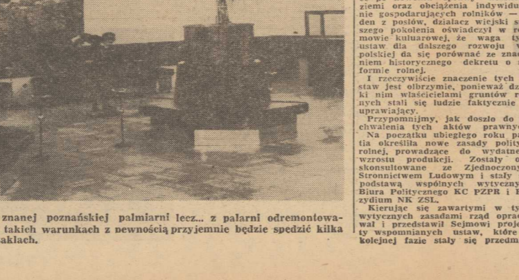
TO NIE JEST ZDJĘCIE ze znanej poznańskiej palarni lecz... z palarni odremontowanego Teatru Współczesnego.

Rozmawiał: J. TIMEN