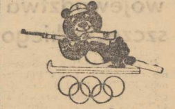
Sobota w Sapporo