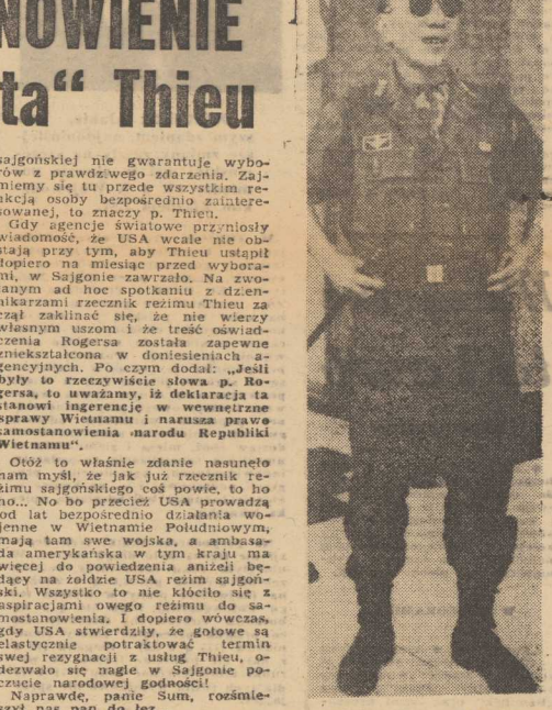
(Z. W.) NA ZDJĘCIU — „prezydent” Thieu

UWAGA CZYTELNICI! W niedzielnym numerze „Kuriera” zamieścimy obszerny, całostronicowy poradnik-informator dla wszystkich wybierających się do NRD.