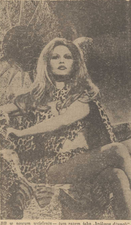
BB w nowym wcieleniu — tym razem jako „królowa dzungli”.

WASZYNGTON PAP. Przy dziewięciu słynnej modlił „Gdy wszyscy święci idą do nieba” żegnał w piatek Nowy Orlean słynną amerykańską piosenkarkę Jazową Margaret Jackson. Ktoś przed 60 laty urodziła się w tym mieście. Wielotysięczne tłumy towarzyszyły jej w ostatniej drodze. 65 tys. osób przedkładało przed jej trumną.