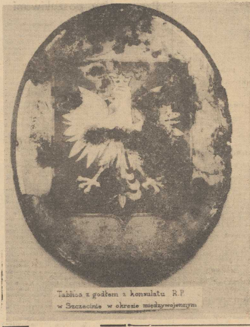
Tabela z godłem konsulatu R.P. w Szczecinie w okresie międzywojennym