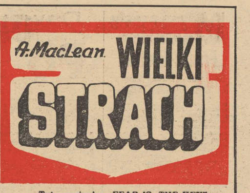
Tyt. oryginału: „FEAR IS THE KEY” tłumaczył: Mieczysław DERBIEN

OSTATNIO prowadziliśmy cykl zajęć w ramach konferencji szkolnych organizowanych przez Wojewódzki Ośrodek Metodyczny... Wspomniamy - na strych. Tąj nie miłośni się pracownia plastyczna. Pod okiem Aleksandry Kukli dzieciarnia z wyobraźni maluje ilustracje do bajek napisanych przez francuskich rzeźbiarzy.