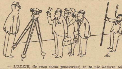
— LUDZIE, ile razy mam powtarzać, że to nie kamera telewizyjna tylko teodoliti!

ZESPÓŁ angielskich naukowców opracował ostatnio — jak donosi o tym czasopismo „Birmingham Post” — oryginalna technologia wykorzystania makulatury na pokarm dla świń. Polega ona na dodaniu do celulozy otrzymanej z makulatury związków azotowych i przyrobieciu tak otrzymanej masy przez odpowiednie szczyby bakterijne. Czy będzie to smaczniejsze mięso, a otrzymane z nich mięso — ludziom, na razie nie wiadomo... (AR-WEZ)