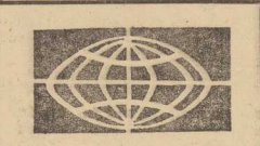
JAPONIA NAWIĄŻE STOSUNKI DYPLOMATYCZNE Z NRD

Z WCZORAJSZYCH relacji prasowo - radiowo - telewizyjnych dowiedzieliśmy, że nasza delegacja partyjno-rządowa z tow. tow. Edwardem Gierkiem i Piotrem Jaroszewiczem na czele, przebywająca przez 3 dni w Bulgarii, odwiedziła w czasie tej wyjątkowo roboczej wizyty Zakłady im. 6 Września „Elektrocaren“ w Sofii, znane przede wszystkim w naszym kraju z importu wózków akumulatorowych i elektroaktywów. Ponieważ przed kilkoma dniami miałem okazję osobiście być gościem tego uznanego w skali światowej przedsiębiorstwa, w związku z tym nieco szerzej o tym interesującym zakładzie.