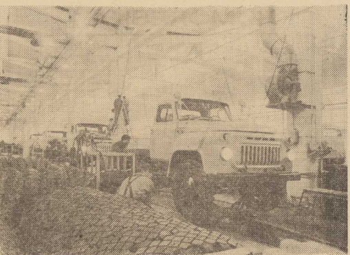
MONTAŻ samochodów ciężarowych w fabryce „MADARA“ w Szumenie, rozwijającej się przy współpracy z Czechosłowacją.

Układ otwiera drogę NRD i NRF do ONZ, co zwiększy stopień uniwersalności tej organizacji. I wreszcie zwiastuje zwycięstwo racji, czego wyrazem jest wypracowane porozumienie, urealnienie szans zbliżającej się europejskiej konferencji bezpieczeństwa i współpracy, przetworzenia odprężeniowych perspektyw w trwałą jakość. (AR) J. R.