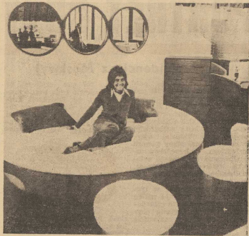
„DOM-73”. Pod takim hasłem trwała otwarta wystawa w Budapeszcie wystawa mebli i wyposażenia mieszkań. Uczestniczy w niej 75 firm węgierskich i zagranicznych.

Po tygodniu rozmów pomiędzy delegacjami obu Jemenuw jedno jest pewne. Nie rozwiązały one nabrzmiałych od lat problemów, wysunęły za to propozycje, której realizacja rozładowałaby sytuację w sposób zasadniczy. Czy zostanie ona zrealizowana? Na pytanie to nie ma jeszcze w tej chwili odpowiedzi. (AR)