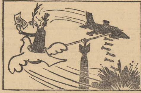
Polityka USA wobec Wietnamu.

LONDYN PAP. Według doniesień Agencji Reutersa, w północnej części Tanzanii zaobserwowano w ostatnich dniach wielkie chmary szarańczy, która nawiedziła blisko 400 tys. hektarów. W Afryce wschodniej istnieje obawa, że szarańcza może przenieść się do sąsiednich krajów i spowodować ogromne straty materialne. Międzynarodowa organizacja kontroli szarańczy, której centrala znajduje się w Zambii, przygotowuje akcję odrywania.