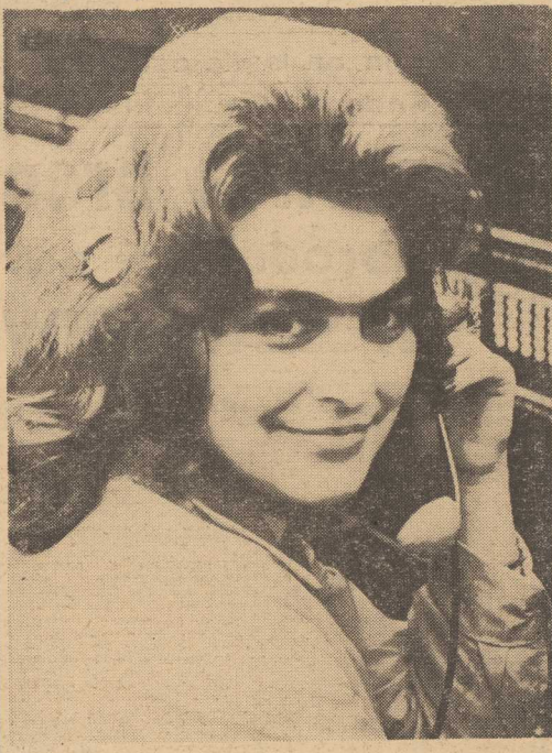
DZIS ŚWIĘTO ŁĄCZNOŚCIOWCÓW — a więc mówimy im: WSZYSTKIEGO NALEPSZEGO!