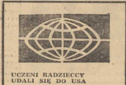
UCZENI RADZIECY UDALI SIĘ DO USA

♦ W niedziele udali się do USA czelowie uczeni radziecy. Delegacja, na której ciele stoi przewodniczący Akademii Nauk ZSRR Mstislaw Keldysz, weźmie udział w dorocznym zgrupowaniu Akademii Nauk USA oraz zapozna się z organami pracy naukowej w instytucjach tego kraju.