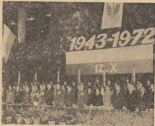
NA ZDJECIU: prezydium uroczystej akademii w Szczecinie z okazji 29 rocznicy powstania Ludowego Wojska Polskiego.