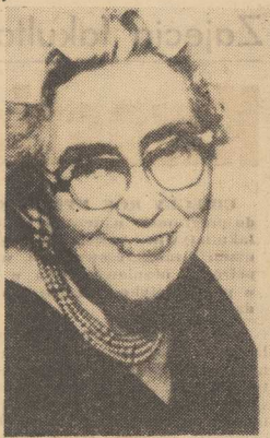
OTO bohaterowie nowego skandalu jaki wywołał Howard Hughes: matka prezydenta Nixona i jego brat Donald, którym Hughes (z prawej) pożyczył 205 tys. dolarów. Warto dodać, że zdjęcie Hughesa — sprzed 20 lat jest jednym z dwu, czy trzech, jakie udało się zrobić po wojnie!