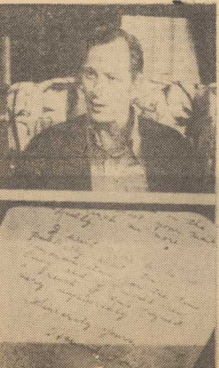
CLIFFORD IRVING, dziennikarz, który opracowuje bibliografię Hughesa i który ujawnił fakt nie zwolonej przez rodzinę prezydenta Nixona pożyczki.

Na drugim zdjęciu — upoważnienie (czy też rodzaj autoryzacji) jaką otrzymał od Hughesa Irving podczas opracowywania bibliografii, przedstawiła w audycji telewizyjnej poświęconej kontrowersyjnej książce.