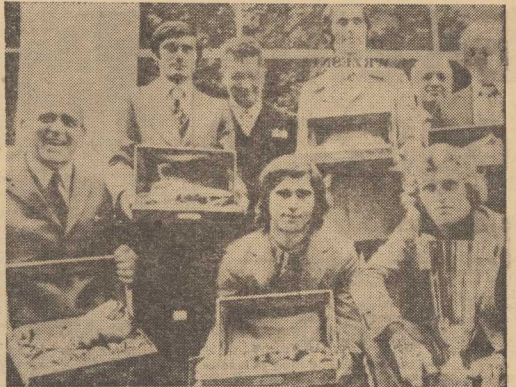
21 BM. W PARYŻU odbyła się uroczystość wręczenia najlepszemu piłkarzowi Europy nagród.

21 BM. W PARYŻU odbyła się uroczystość wręczenia najlepszemu piłkarzowi Europy nagród. Na zdjęciu: od lewej, w górnym rzędzie - Jugosłowianin Centrac z zdobytymi „Brazowymi Butami”;