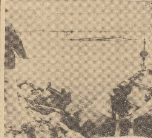
14 BM po starciu z lotniską w San Francisco wpał do morza samolot transportowy linii TWA. Trzech członków załogi katapultowało się z maszyny. Wyłowili ich motorówka amerykańskiej straży przybrzeżnej.

STOSUNKI między Ugandą a Tanzanią i Wielką Brytanią są już od dłuższego czasu napięte.